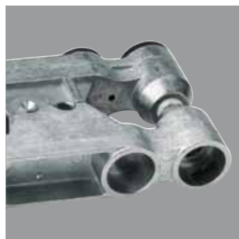
Pinza antidéflagrante Pince antidéflagrant Explosion-proof earthing clamp Explosiongeschützte Zange

Automatic cable reel equipped with 15 m x 6 mm 2 yellow/green cable and by request supplied with earth clamp certified in accordance to the regulations laid down in the standard directive 94/9/CE ATEX. This clamp allows the connection with the earthing system to create an equalization of potential between containers of inflammable products (liquids gas or powder) or those in areas of danger from explosion; this connection must be carried out respecting the appropriate regulations with the correct appliances such as the earth clamp that firmly connect to any hold (from 3 to 20 mm) even on rusty surfaces, assuring the continuity of current, provided with reopening-anti-tearing system.