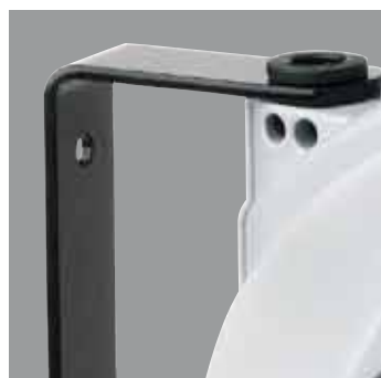
Staffa in acciaio verniciato orientabile Patte de fixation murale orientable en acier Steel wall swivelling bracket Schwenkbare Halterung aus Stahl