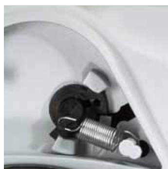
Sistema di bloccaggio del cavo a lunghezza desiderata Système de blocage du câble à longueur désirée Cable ratched stop device easily removable Sonder-Kabel Arretierungsvorrichtung