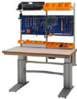
Työpöytä sähkösäätöisillä jaloilla