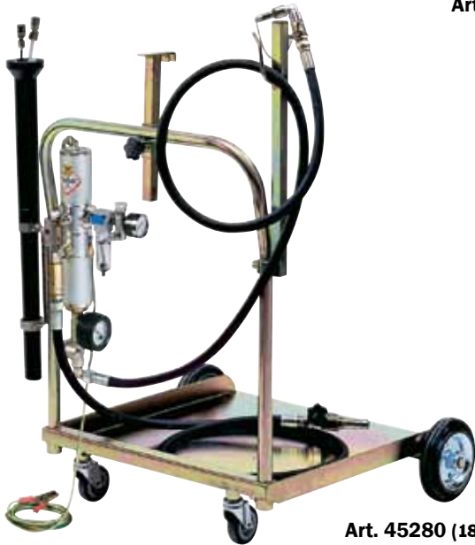
Art. 45280 (180 - 220 Kg)